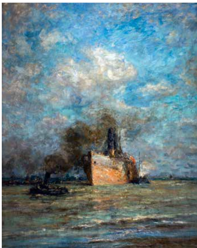
Franz Courtens, De steamer 'Brussels' geborgen in Zeebrugge , 1919, olieverf op doek, 139 x 110 cm PRIVÉVERZAMELING