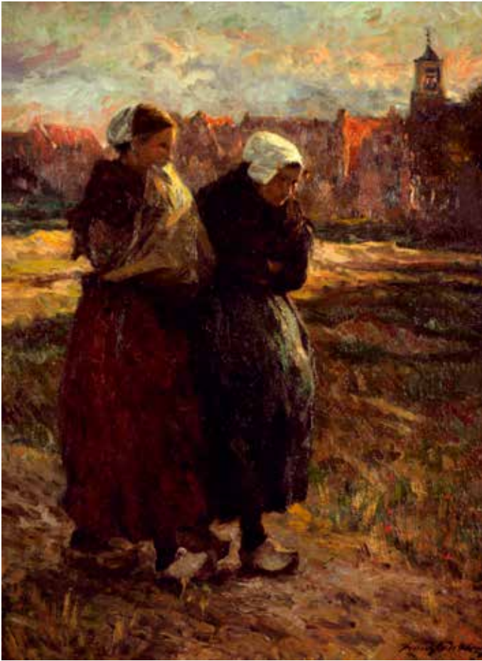
Franz Courtens, Na de begrafenis , 1894, olieverf op doek, 103 x 78 cm