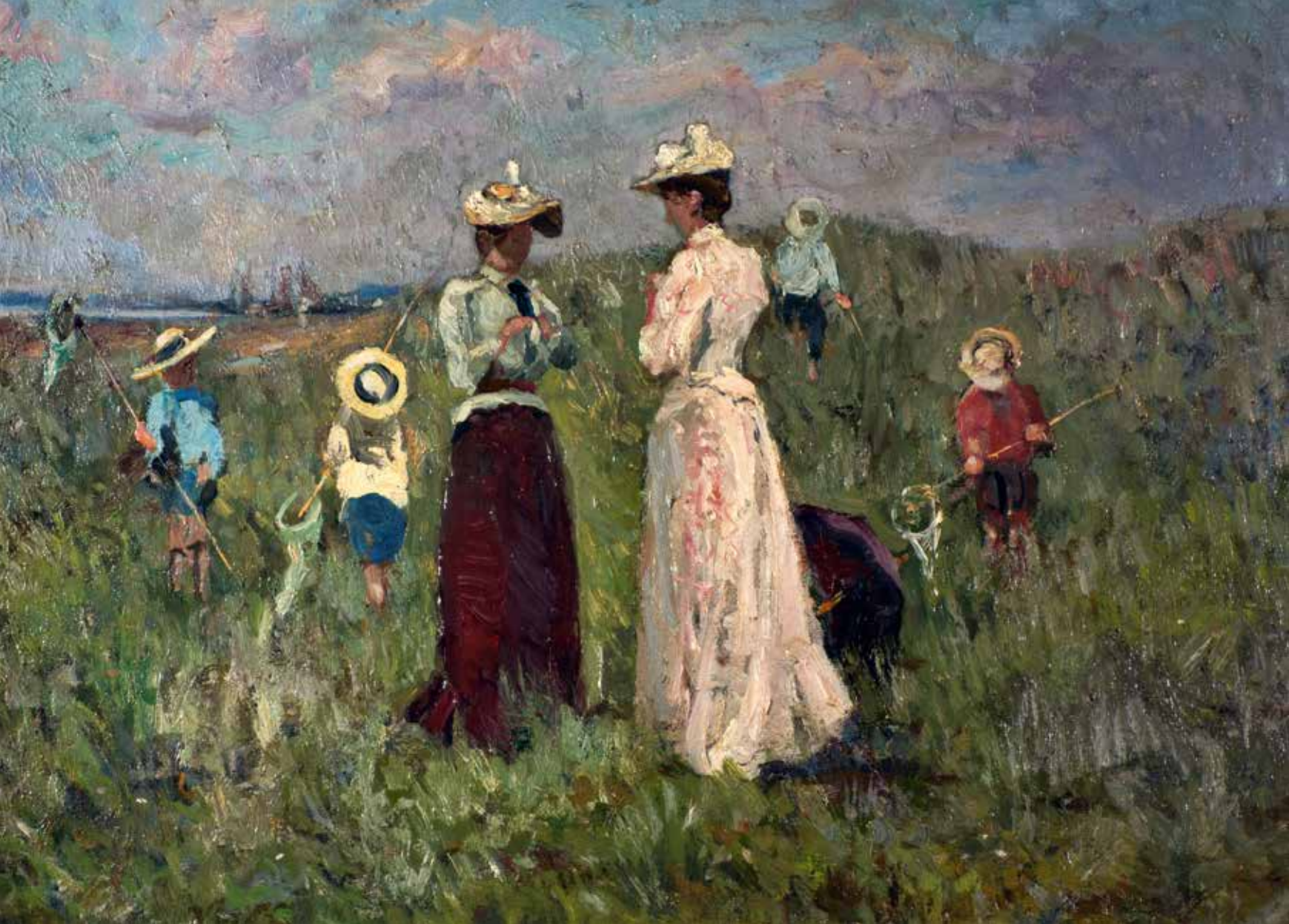
Frans Courtens, De vlinderjacht , ca. 1899, olieverf op doek, 64 x 90 cm PRIVÉVERZAMELING