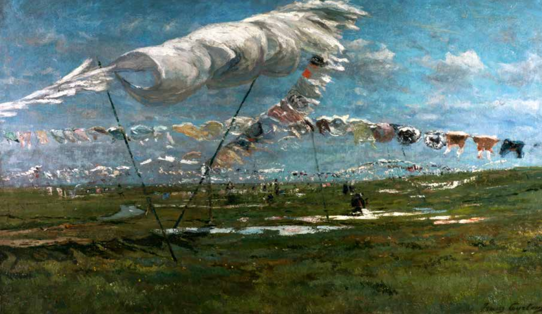
Franz Courtens, Het drogende linnen in de weide te Urk , ca. 1892, olieverf op doek, 110 x 190 cm PRIVÉVERZAMELING

Aan erkenning heeft Courtens geen tekort gehad. De jonge schilder die tegen de zin van zijn vader in voluit voor het kunstenaarschap kiest, heeft het geluk vrij vlug kopers te vinden die in zijn kunst geloven. Werken worden bekroond en de tentoonstellingen volgen elkaar op, in binnen- en buitenland. Flatterend nevenverschijnsel van dat succes: hij krijgt af te rekenen met vervalsers; altijd een goed teken. Dan wordt hij in de adelstand verheven. De koning stelt hem het park van het Kasteel van Laken ter beschikking en drukt hem zelfs de sleutel van een achterpoortje in de hand. Bij leven wordt in Dendermonde een straat naar hem genoemd. Kort na zijn dood krijgt hij er eveneens een standbeeld, een werk van zijn zoon Alfred Courtens. Koningin Elisabeth komt het onthullen. Courtens was inderdaad een gevierd artiest.